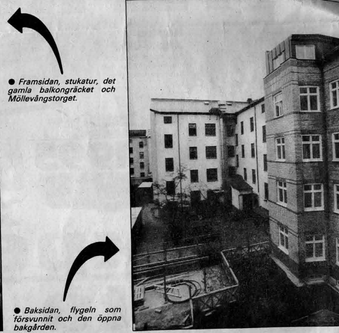
● Framsidan, stukatur, det gamla balkongräcket och Möllevångstorget.